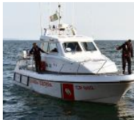
In azione la Guardia costiera

All'epoca la parte meridionale del lago di Garda, da Punta San Vigilio alla penisola di Sirmione, fu scandagliata con un sistema multibeam (un robot di profondità dotato di sofisticatissimi sensori capaci di trasmettere in superficie un'immensità di informazioni riguardanti l'attuale assetto geomorfologico del fondo lago e valutare il rischio sismico.