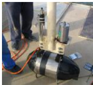
Il robot che mapperà i fondali

L'area specifica della ricerca è quella tra Salò, la Valtenesi, Punta San Vigilio e Sirmione