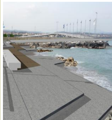
La passeggiata a lago e la darsena Lepanto: il percorso finisce lì

Sulla passeggiata a lago resta lo scoglio Lepanto «Il passaggio è rischioso»